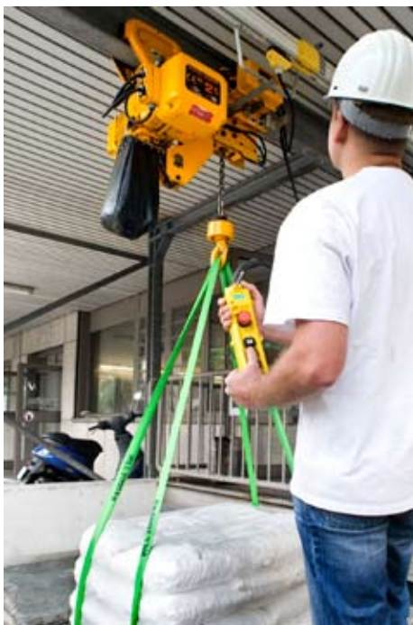
Elektrokettenzug als kurze Katze im Einsatz in einem Krankenhaus.

Aber auch die Frage der Ergonomie war bei GKM ein großes Thema. „Die Gesundheit unserer Mitarbeiter liegt uns sehr am Herzen“, berichtet Winkler. „Daher war von vornherein klar, ein Produkt einzusetzen, mit dem die Mitarbeiter ohne Probleme arbeiten können. Denn schließlich handelt es sich hier um